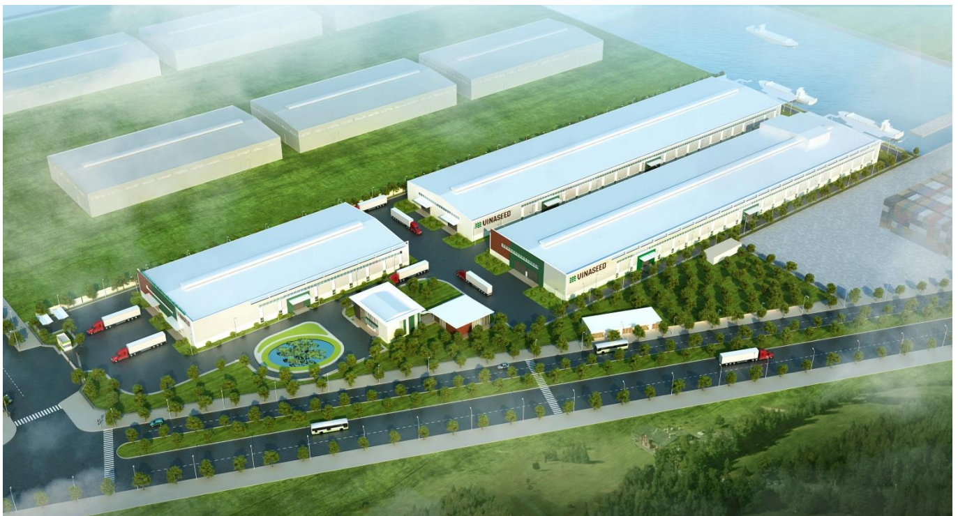
Ảnh: Dự án trung tâm công nghiệp chế biến hạt giống và chế biến nông sản Đồng Tháp Quy mô: 5 ha, công suất CB: 30.000 tấn hạt giống và 50 – 60 nghìn tấn gạo (GD1)